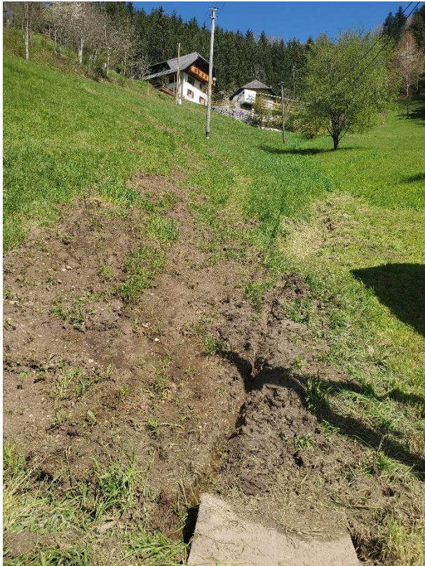
Foto 3: Feuchte Senke mit offenem Boden etwa im Zentrum des Plangebiets